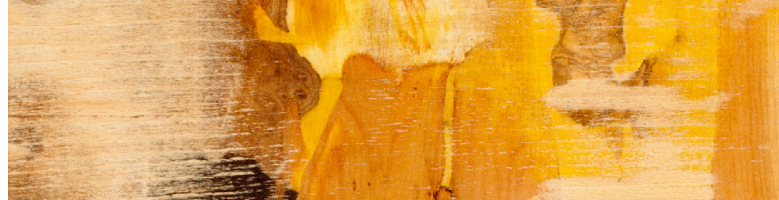
© Hannes Bok, fragment de «Promenade von Mussorgsky»

SI Re a enregistré une demande croissante, s'agissant notamment des couvertures de fréquence pour les catastrophes naturelles. Cette évolution peut se comprendre comme une préparation à la mise en œuvre de Solvency II dans un futur proche. Pour l'année 2010, SI Re constate une hausse de la fréquence des sinistres de moyenne importance dans les affaires à court terme. Selon